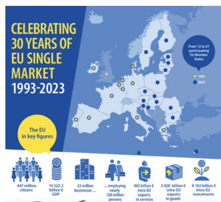
EL MERCADO ÚNICO EUROPEO CUMPLE TREINTA AÑOS.